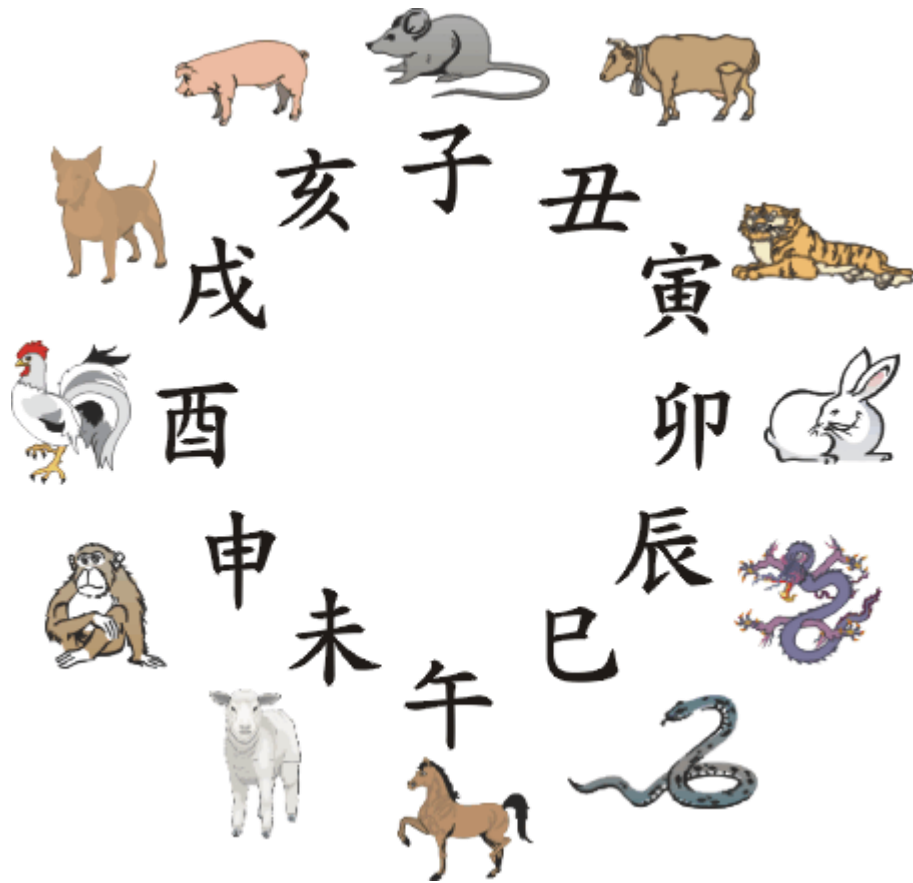
十二生肖与时辰的结合