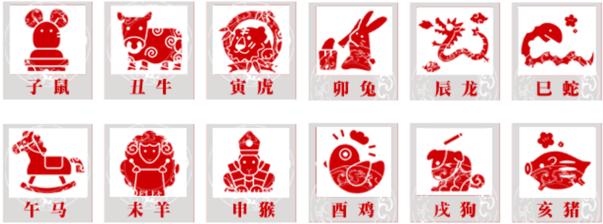
十二生肖对照表 十二生肖纪年对照表